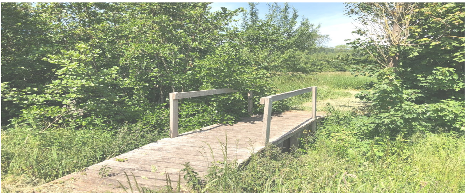
Parc de la Peupleraie, espace naturel, Impasse de la Presle