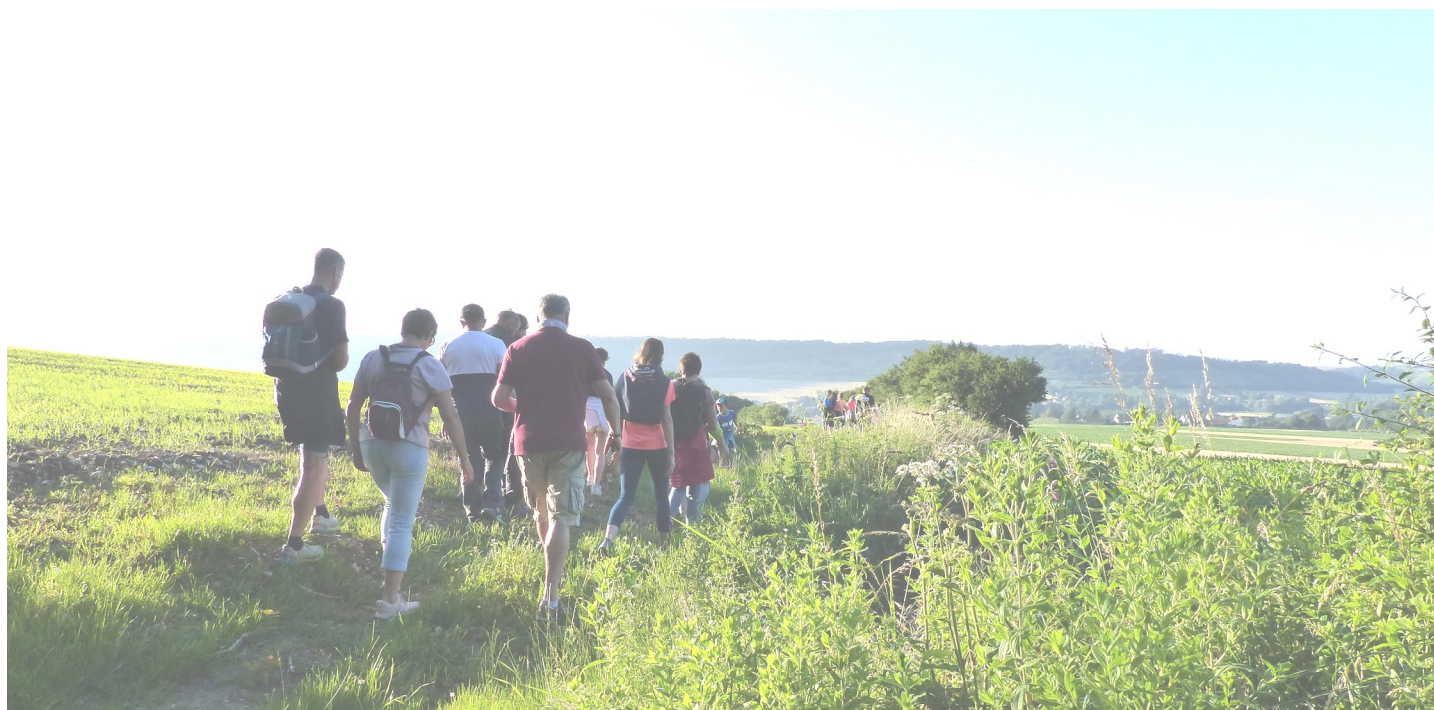
Randonnée du 16 juillet 2021