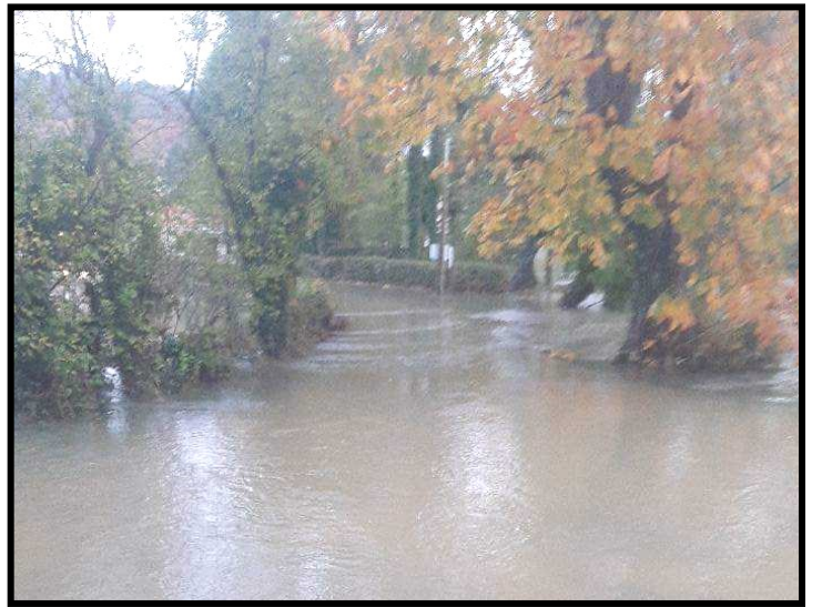
À gauche: photos prises à Audenfort